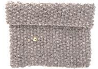
En Route tube